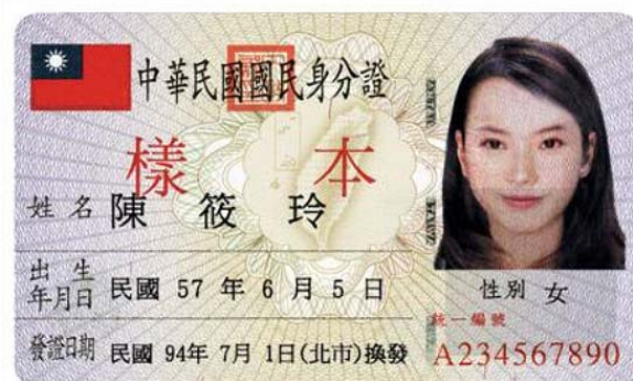
圖 3：內政部公布的舊版身分證