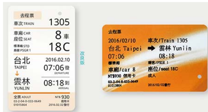
圖 1：改進設計的高鐵車票